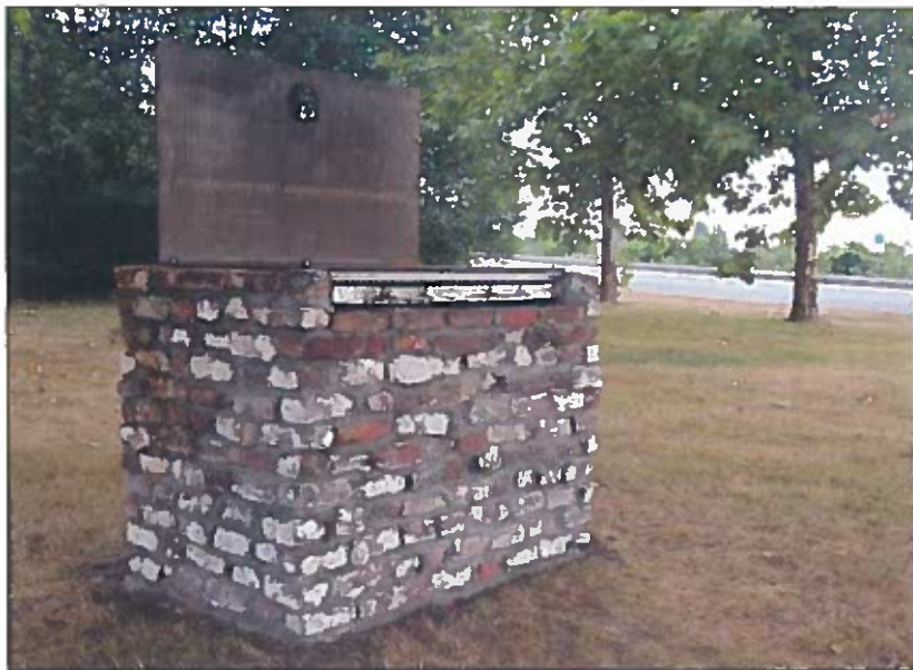
Het monument.

aanval op 31 oktober 1918 leidde. Het eerste ontwerp werd getekend door José da Cruz (Antwerpen) en verder afgewerkt door Lies Dierckx (Nevele). Het bestaat uit een plaat in Cortenstaal. Deze stalen plaat van 10 mm dikte en afmetingen 120 op 140 cm werd uit één stuk gemaakt. Staal symboliseert wapens en munitie. Kanonnen, granaten, geweren, munitie en machinegeweren waren van staal. In het horizontale deel van de plaat is het aanvalsplan van Valère De Boodt in gestileerde vorm weergegeven.